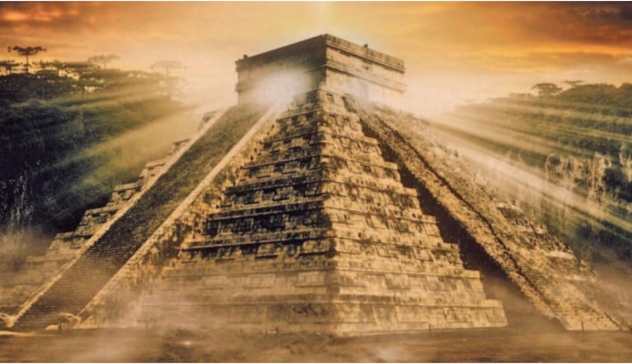
Es la mayor y más antigua estructura maya conocida hasta la fecha.

El sitio se encuentra en el estado de Tabasco.