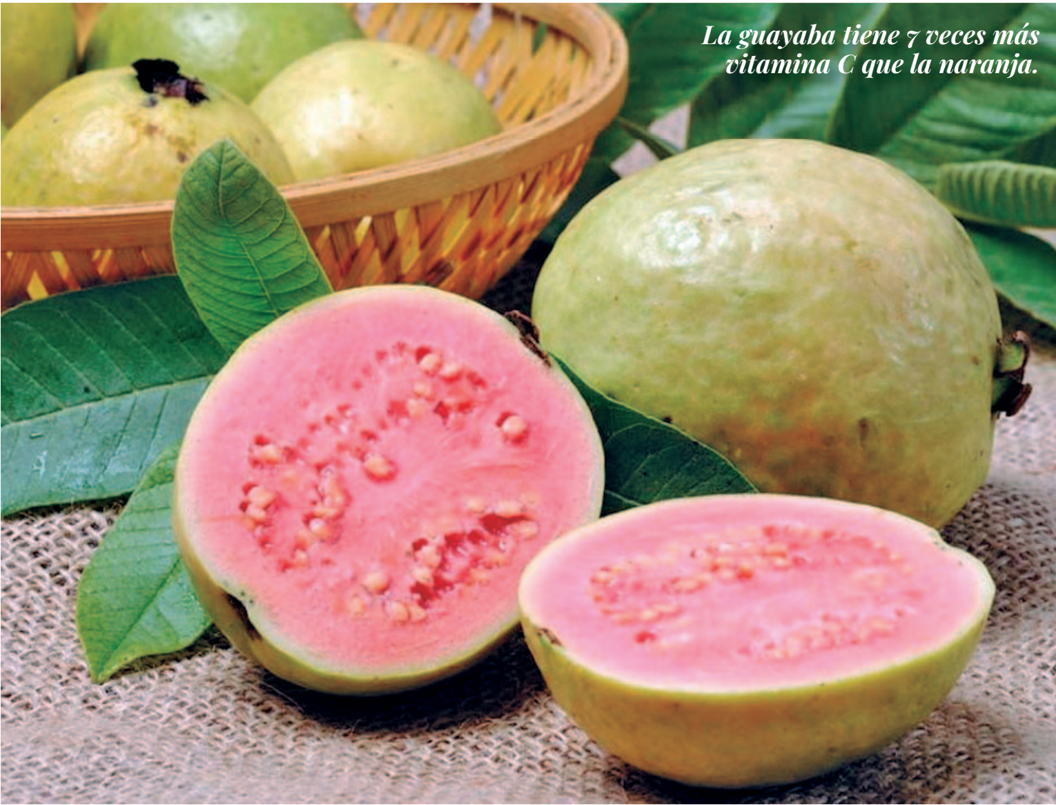
La guayaba tiene 7 veces más vitamina C que la naranja.

Por su aporte de vitamina C y provitamina A, se recomienda su consumo a toda la población, y especialmente, a quienes tienen un mayor riesgo de sufrir caren-