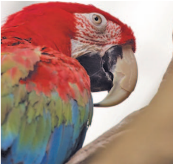
MANGO, EL GUACAMAYO DE ALAS VERDES